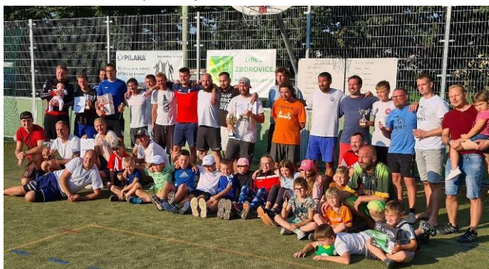
Kolektiv TJ PILANA ZBOROVICE

Závěrem je potřeba poděkovat všem našim sponzorům – partnerům, kterých postupně přibývá a za, které jsme vděční. Také obecnímu úřadu ve Zborovicích. Bez jejich finanční pomoci by nebylo možné areál TJ modernizovat a hlavně hrát fotbal na krajské úrovni! A všem, kteří se podílejí na chodu TJ.