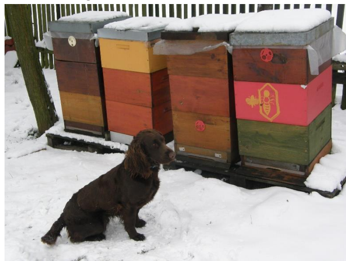
Německý křepelák Nora na včelnici

Včelaři v našich obcích měli v loňském roce radost z toho, že se našim končinám vyhnul mor včelího plodu; také varroázu, jejíž původce, asijský roztoč VARROA DESTRUCTOR, likviduje včelstva, se nám vhodným léčením dařilo udržovat v patřičných mezích. Já sám již několik roků s úspěchem používám přípravek Apiguard, který se vyrábí ve Velké Británii. Je to zcela přírodní léčivo na bázi thymolu, který se získává z tymiánu. V letošním roce jím bude ošetřovat včelstva celá naše zdounecká organizace.