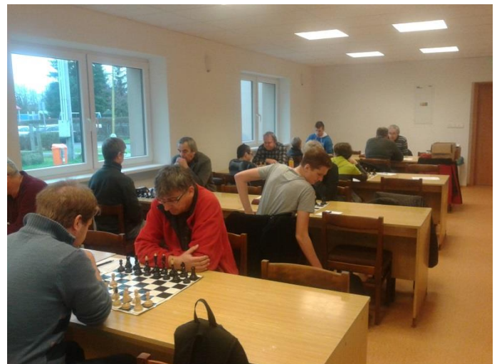
V pěkných zrekonstruovaných prostorách Sokolovny Ačko jasně zvítězilo v 3. kole Krajské soutěže nad Postoupkami B

Jako každoročně naše družstva zahájili novou sezonu v měsíci říjnu. Družstvo A v Krajské soutěži – západ získalo v úvodních třech kolech 6 bodů a vytvořilo si na začátek velmi solidní pozici. V tabulce zaujímá 4 místo. V domácím prostředí porazilo v prvním kole Zlín C v poměru 5,2 : 2,5.