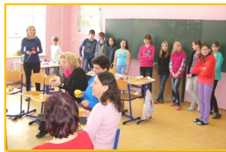
Oslava Dne učitelů v VI. třídě