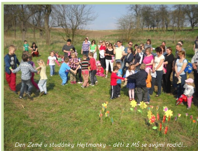
Den Země u studánky Hejtmanky – děti z MŠ se svými rodiči...