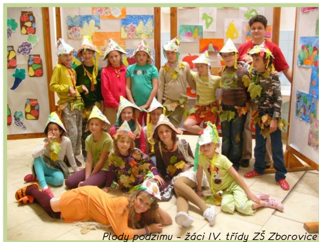
Plody podzimu - žáci IV. třídy ZŠ Zborovice

Do rukou se Vám dostává podzimní číslo Zpravodaje. Najdete v něm nejen důležité informace a zajímavosti z dění v našich vesnicích, součástí je i kalendář akcí na nejbližší dobu. Děkujeme všem za zasláné příspěvky a fotografie. Věříme, že i v roce 2013 nám zůstanete věrni! Příjemné čtení!