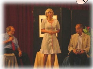
▲ R. Hrušínský, J. Švandová a J. Carda